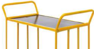
Plateau supérieur (tablier obligatoire)