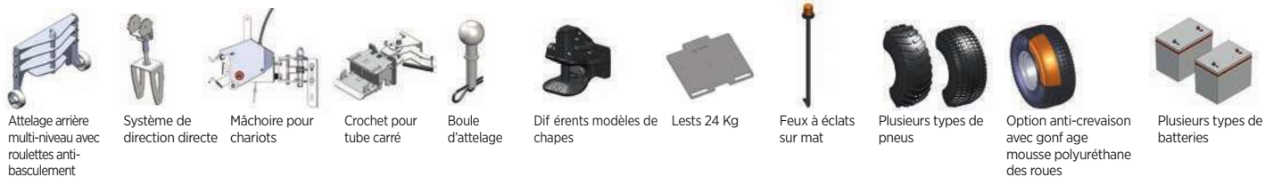
Attelage arrière multi-niveau avec roulettes anti-basculement